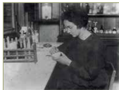
Figura 2. Irène Joliot-Curie (1897-1956).