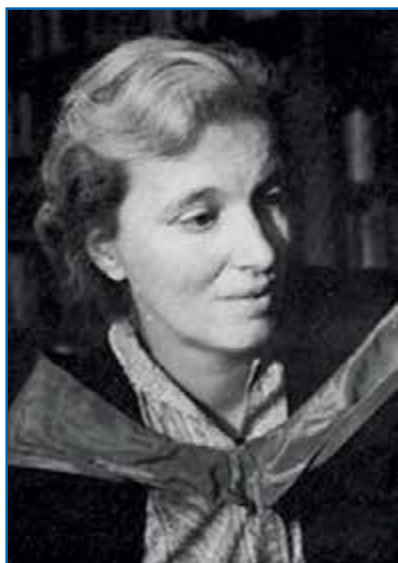
Figura 1. Dorothy Crowfoot Hodgkin (1910-1994).

Dorothy Crowfoot Hodgkin (fig. 1) va nèixer a la ciutat del Caire, va estudiar química al Somerville College de la Universitat d'Oxford i es va doctorar a la Universitat de Cambridge el 1934, on es va especialitzar en cristal·lografia, sota la tutela de John D. Bernal, disciplina de la qual va ser professora a Oxford fins al seu retir el 1977.